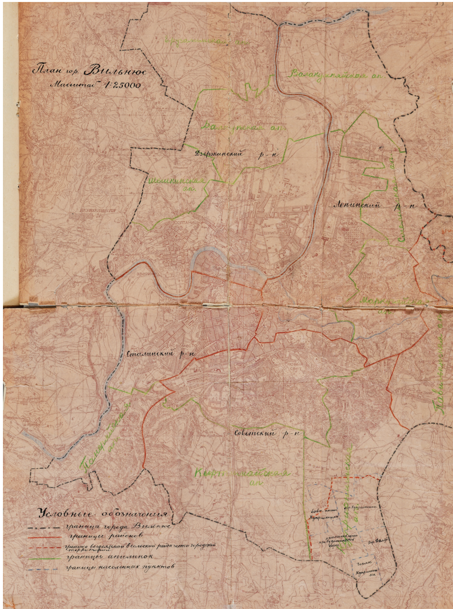
2 pav. Vilniaus miesto teritorija šeštojo dešimtmečio pradžioje. LCVA, f. R-758, ap. 4, b. 330, l. 59.