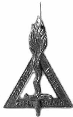
1 pav. Karinės ložės „Vilnius liepsnojančiam kalavijui“ nario ženklelis.