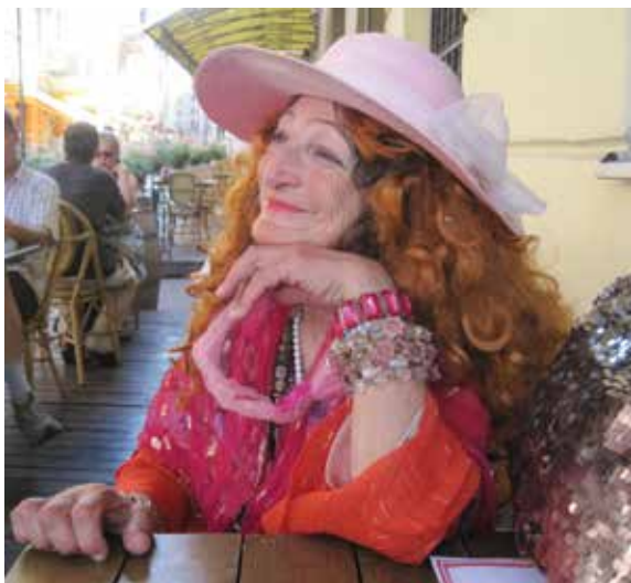
1 pav. Ši nuotrauka Vidutei patiko. 2012 m. vasara.