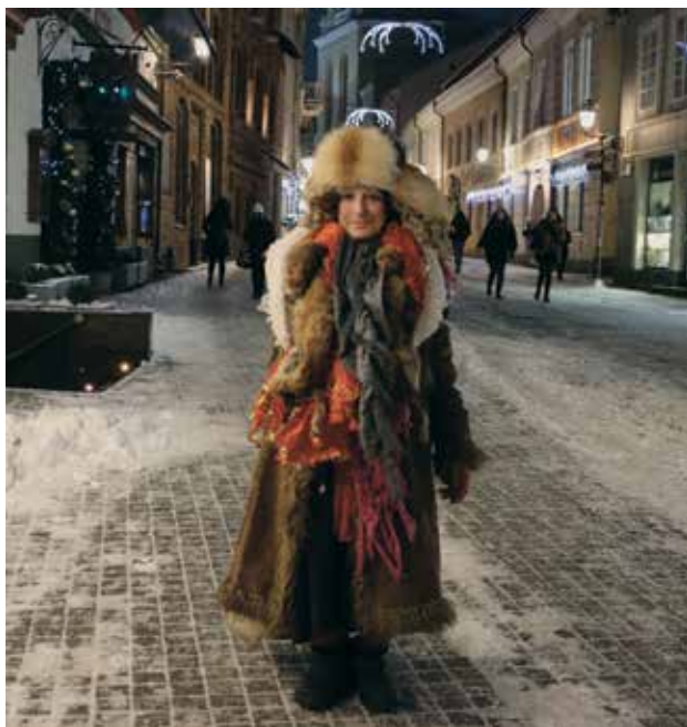
6 pav. Vidutė Pilies gatvėje. 2016 m. lapkritis.