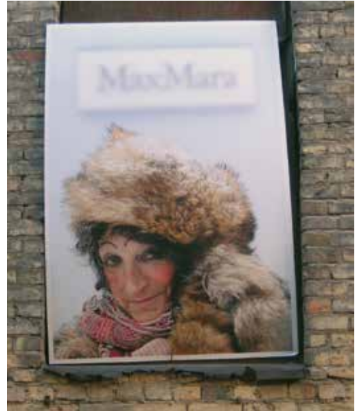
8 pav. Vidutės Gumbytės-Rožytės nuotraukos Šv. Kazimiero gatvėje.