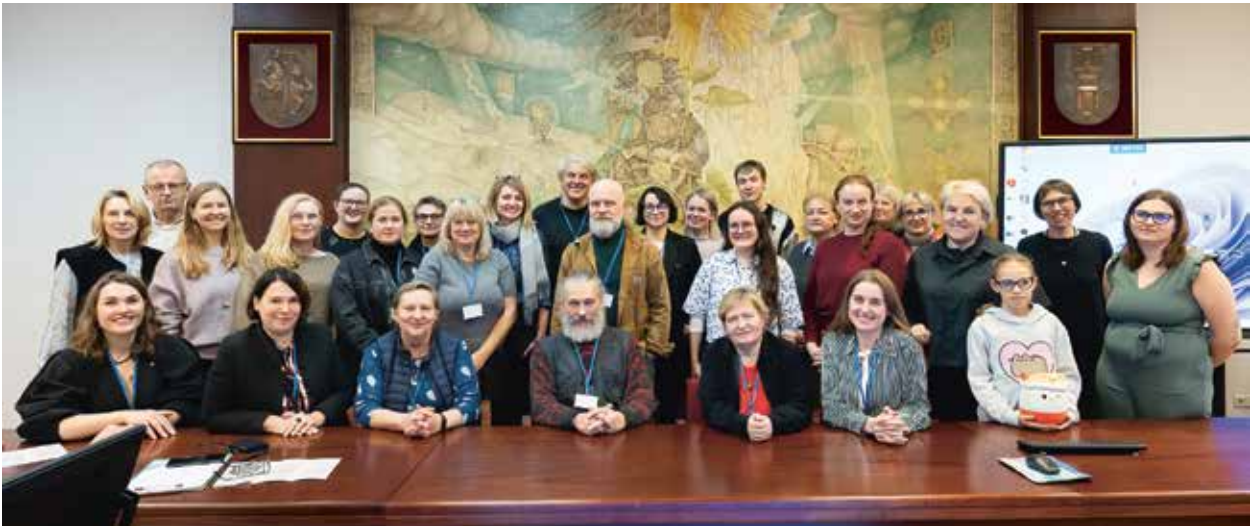
4 pav. Ketvirtosios „Archaeologia Urbana“ konferencijos dalyviai ir svečiai.

Fig. 4. Participants and guests of the fourth Archaeologia Urbana conference.