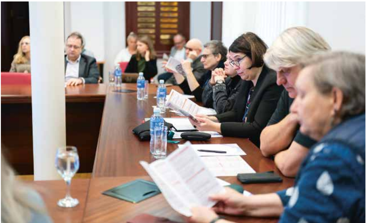
1 pav. Ketvirtosios „Archaeologia Urbana“ konferencijos dalyviai. Fig. 1. Participants of the fourth Archaeologia Urbana conference.