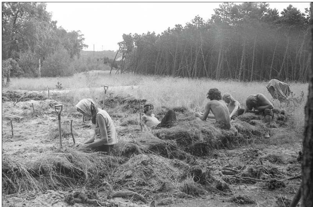
6 pav. Poilsio akimirka pievoje (Nidos senovės gyvenvietės tyrimai, LIIR, negatyvo Nr. 37456)