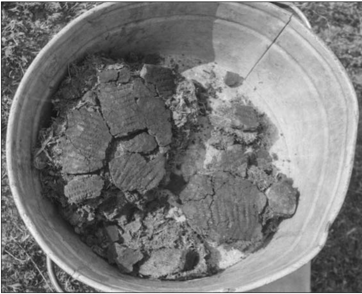
7 pav. Iš perkasos – į kibirą, iš kibiro – į muziejų

ir atsirinkti tai, kas svarbiausia. Aš skaičiau ir rašiau labai greitai.