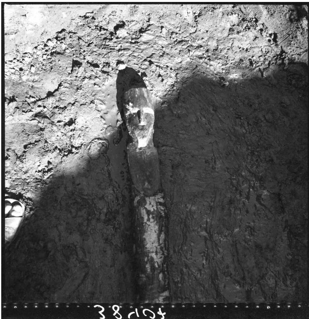
1 pav. Kai susitinka žemiška ir nežemiška: žmogus atranda Šventosios dievą. (Šventosios akmens amžiaus gyvenviečių tyrimai, LIIR, negatyvo Nr. 38358)