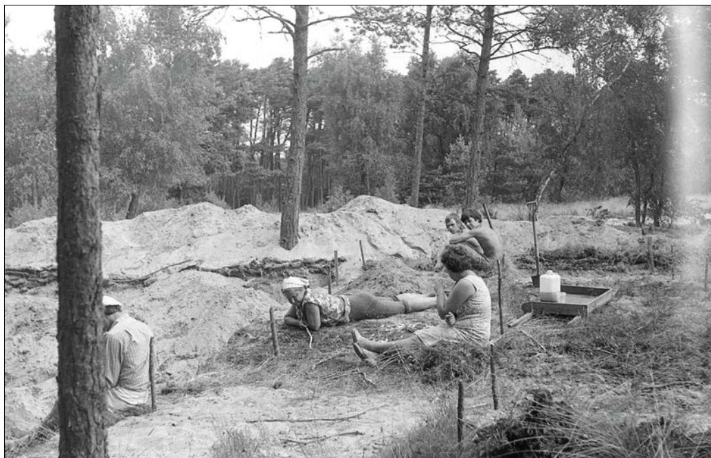
5 pav. Laikas apmąstymams (Nidos senovės gyvenvietės tyrimai, LIIR, negatyvo Nr. 37458)