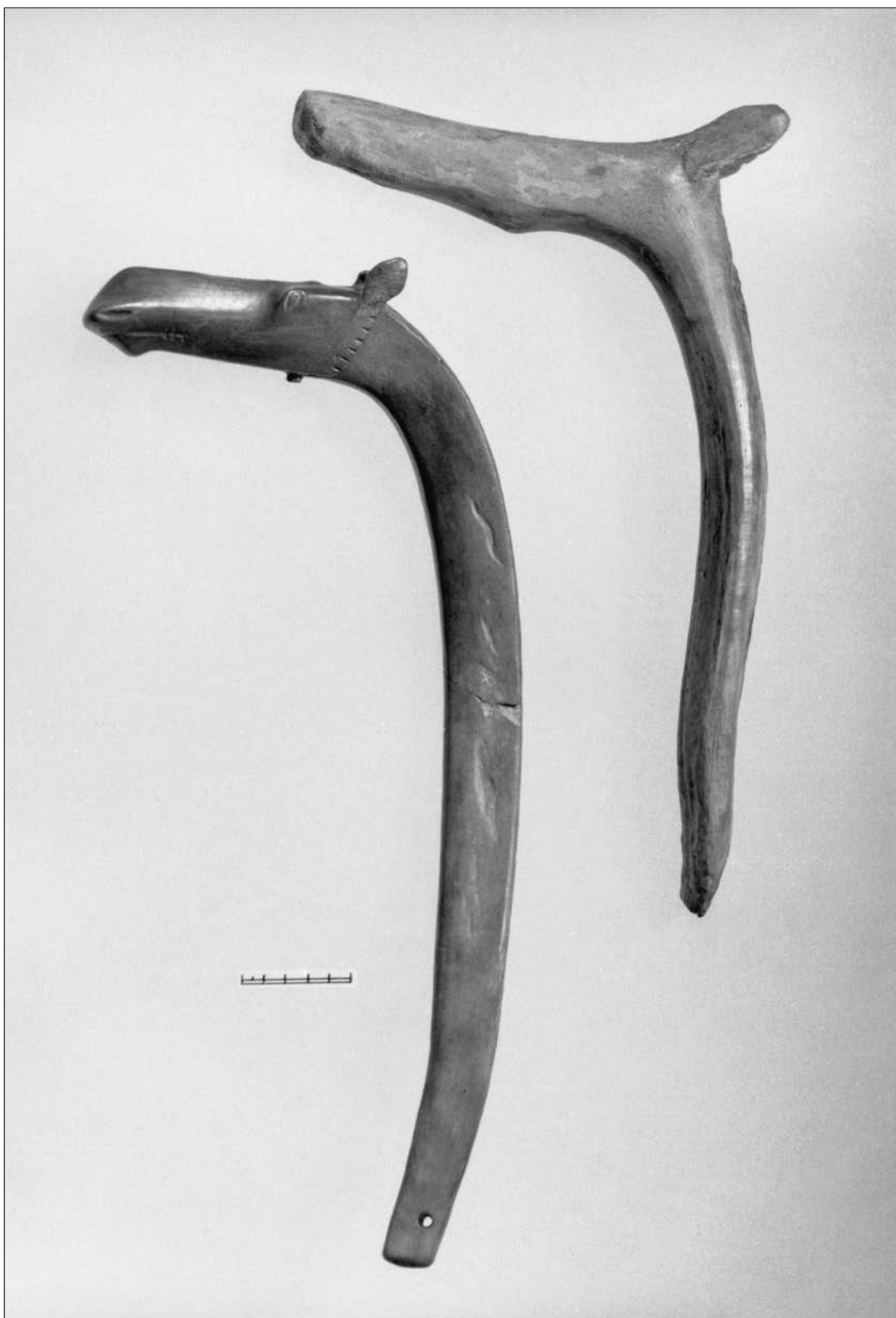
3 pav. Apeiginės lazdos iš Šventosios (Šventosios akmens amžiaus gyvenviečių tyrimai, LIIR, negatyvo Nr. 39324)