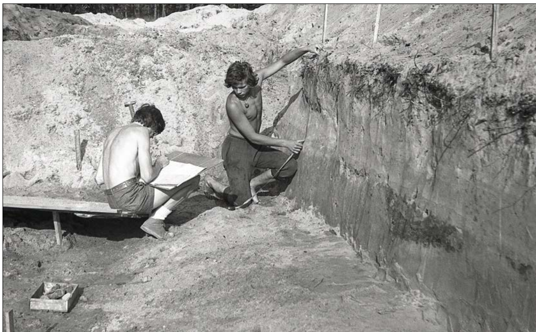
4 pav. Jaunieji profesionalai (Nidos senovės gyvenvietės tyrimai, LIIR, negatyvo Nr. 60489)

R.R.: Oi, kalbų mokėti yra būtina! Nieko nepadarysi, bet reikia... Man tėvai sudarė sąlygas mokytis kalbas: vokiečių, prancūzų... Gal kurią šiek tiek primiršau, bet tekstus paskaityčiau. Lenkų kalbą pramokau Vilniuje, universitete. Švedų kalbą mokiausi savo noru, paskutinėse mokyklos klasėse jau galvojau apie Švediją, ketinau joje studijuoti, vėliau pati į ją išvažiavau. Kalbos ant pečių nenešiosi... Juk svarbiausias dalykas yra knygos, nes juk visko negali pačiuoipnėti, reikia ieškoti informacijos literatūroje. Parašyti gerą mokslinį darbą mokant tik vieną užsienio kalbą yra išties sudėtinga ir sunkiai įsivaizduojama.