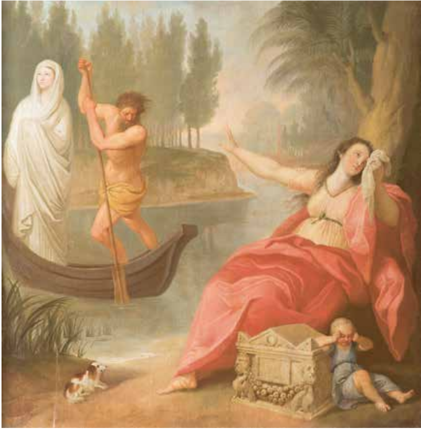
2. Pranciškus Smuglevičius, Charono laivas , drobė, aliejus, 96 × 96,5 cm. Šiaulių „Aušros“ muziejus.

moko savo vaikus, kad jėga vienybėje , pagaliau ir margaspalvėje minioje motinas su kūdikiais ar jau ūgtelėjusius vaikus įvaizdinusios daugiąfigūrės kompozicijos Antikinė auka ir Vestalės vainikavimas 11 .