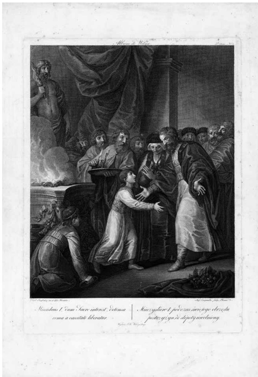
4. Angelo Campanella (~1748 – ~1815), pagal Pranciškų Smuglevičių, Meška I ritualinio apkirpimo metu atgauna regėjimą , popierius, vario raižinys, 57 × 40 cm (lakštas), 37,8 × 30,7 cm (vaizdas), 1850 m. (iš Jono Kazimiero Vilčinskio ( Jan Kazimierz Wilczyński , 1806–1885) Vilniaus albumo ). Lietuvos nacionalinis dailės muziejus, LNDM G 3749.