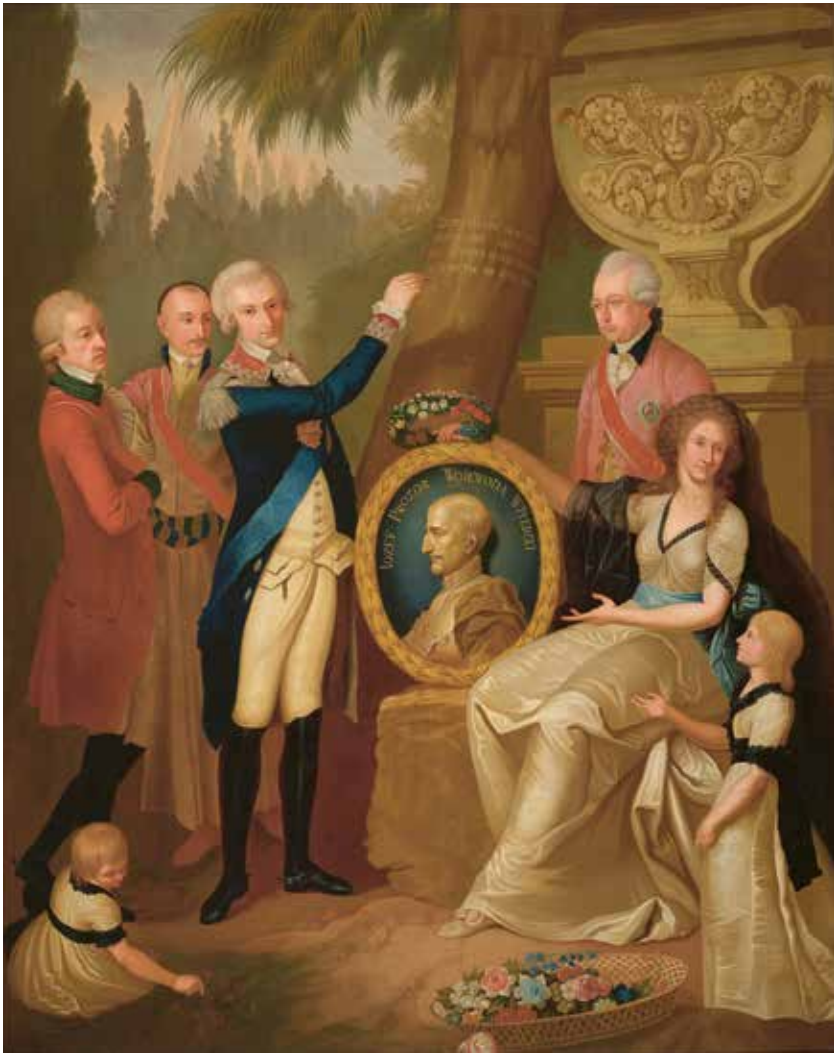
6. Pranciškus Smuglevičius, Prozorų šeimos portretas , drobė, aliejus, 182 × 144 cm, 1789 m. Nacionalinis muziejus Varšuvoje, MP 225 MNW.