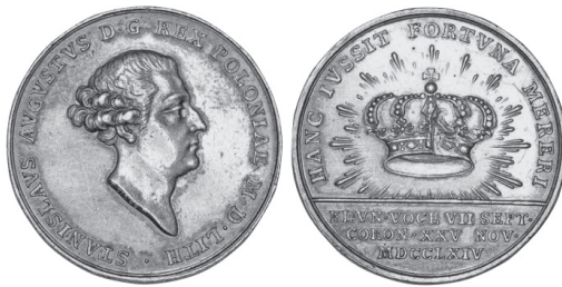
1. Medal koronacyjny Stanisława Augusta Poniatowskiego, srebro, śr. 33 mm, T. Pingo, 1764.

nie staropolska, inspirowana stemmatem i symbolum heroicum , formuła emblematyki, będąca pochodną kultury szlacheckiej 2 . Od lat 60. XVIII wieku zanikają stemmaty akademickie, a od kolejnego dziesięciolecia publikuje się coraz mniej drukowanych opisów dekoracji wykorzystujących słowno-obrazowe konstrukcje emblematyczne. Poezja wizualna, z którą w teorii zestawiano gatunek emblematyczny, po 1764 roku praktycznie nie była już wykorzystywana 3 . W dziejach emblematyki wiek XVIII uważany jest generalnie za czas reedycji i zbiorów o charakterze encyklopedycznym. Obecność porenesansowej symboliki w kulturze uzasadniano m.in. ożywieniem o charakterze edytorskim i bibliofilskim oraz pedagogiczną użytecznością wybranych dzieł 4 . Oświeconym tradycyjnie rozumiana emblema kojarzyła się z literaturą dziecięcą oraz z dziedzictwem obcym estetycznie i intelektualnie 5 . Rozumienie